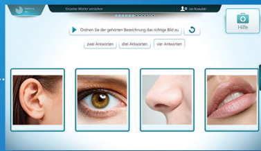
Einzelne Wörter verstehen