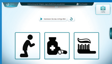
Bedürfnisse ausdrücken können